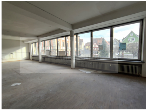
Ladenfläche mit Fensterfront